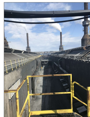
Vue du Centre Électrolyse Ouest (CEO).

Le contexte opérationnel de l'usine Arvida a évolué, ce qui nécessite de revoir nos façons de faire et les moyens entrepris pour contrôler les émissions des salles de cuves.