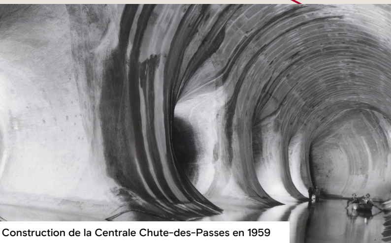
Construction de la Centrale Chute-des-Passes en 1959

Ce premier plan d'action marque notre engagement envers la préservation et la valorisation du patrimoine culturel. Il constitue une étape initiale pour réaliser notre ambition de devenir un exemple en matière de mise en valeur du patrimoine culturel industriel dans nos activités courantes de production d'aluminium. En collaborant étroitement avec les Premières Nations et en renforçant nos partenariats avec la communauté, nous aspirons à façonner un avenir où notre patrimoine culturel enrichit et inspire les générations futures du Saguenay—Lac-Saint-Jean.